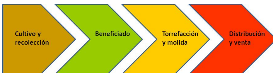
Figura 1: Cadena de valor del café procesado

La obtención de una taza de café implica una serie de etapas que van desde el cultivo del cafeto hasta el producto terminado que se dispone al consumidor en una amplia gama de presentaciones. Cada una de esas etapas implica un valor agregado, el cual es mayor en las fases de procesamiento y comercialización (véase Figura 1). Las etapas de la producción de café destinado a los mercados internacionales están claramente segmentadas entre países productores e importadores. Por lo general, los países productores se encargan del cultivo, cosecha y beneficiado, y empaque del café verde seco en sacos de 60 kg), listo para la exportación. Los países importadores realizan las etapas posteriores, es decir, la torrefacción o tueste, molienda y empaque ya sea para colarlo o procesarse como instantáneo.